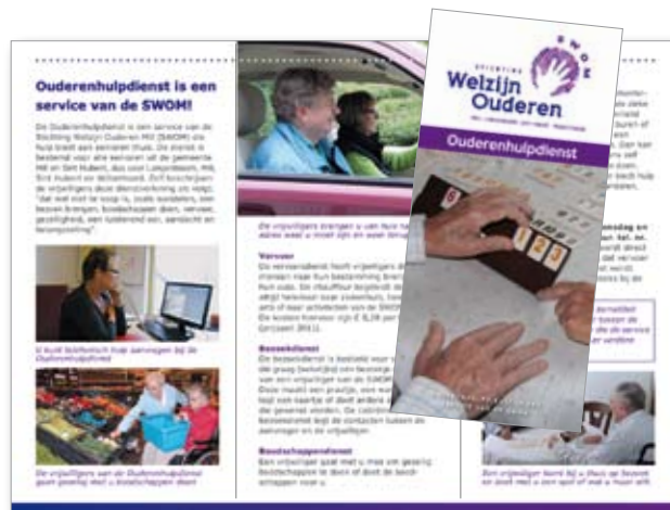
De onlangs uitgebrachte folder 'Ouderenhulpdienst'

Deze maakt een praatje, een wandeling, legt een kaartje, doet boodschappen of doet andere activiteiten die gewenst worden. Een ander belangrijk aspect is het overnemen van de zorg van een mantelzorger voor een beperkte tijd van het familielid, partner, vriend of vriendin. Als u iets voelt voor dit interessante en belangrijke werk, kunt u zich ook op de bovenvermelde manier melden, dan wordt er contact met u opgenomen.