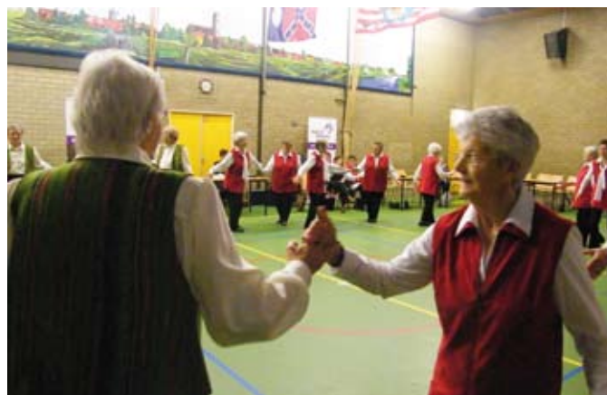
De senioren hebben ieder jaar veel plezier in het dansen

Supporters en belangstellenden zijn van harte welkom om van dit schouwspel te genieten. De entree is gratis. Mocht u zelf ook interesse hebben om te gaan dansen, dan kunt u contact opnemen met de SWOM, tel. 0485-455470, swomill@het.nl