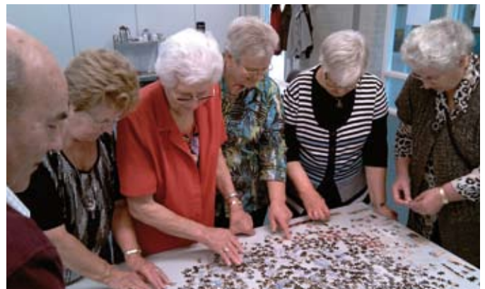
Puzzelen tijdens de Burendag

De Bonte Middag op 1 november a.s. begint dit jaar om 11.30 uur. Zet deze dag en tijdstip vast in uw agenda. Waarom we zo vroeg beginnen? Laat u verrassen! Vorig jaar werd de Langenboomse Bonte Middag druk bezocht. Wij hadden toen een optreden van een goochelaar, die met zijn trucs iedereen deed verbazen. Uiteraard volgt er nog een uitnodiging met het programma en een opgavenstrookje. Wij rekenen weer op een hoge opkomst, graag tot 1 november.