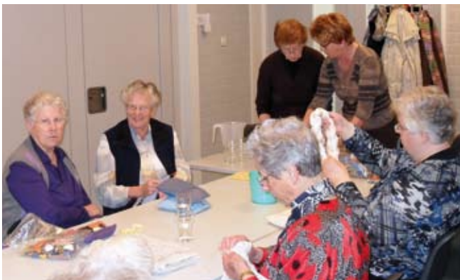
De dames van de Welfare handwerkclub druk bezig met hun handwerkstuk