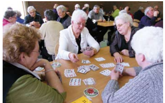
Weer rikken en jokers op 12 oktober in de Wilg

Op deze gezellige middag doen we rikken en jokers en er zijn een aantal mooie prijzen te winnen voor diegenen die op de eerste tot en met de derde plaats eindigen. De SWOM hoopt dat veel senioren komen kaarten op deze middag. Indien u vervoer nodig hebt, kunt u dit aanvragen op maandag, woensdag en vrijdag van 09.00-10.00 uur, tel. nr. 0485-455470.