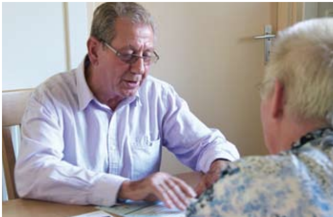
De ouderenadviseur helpt u graag met uw brief of formulier