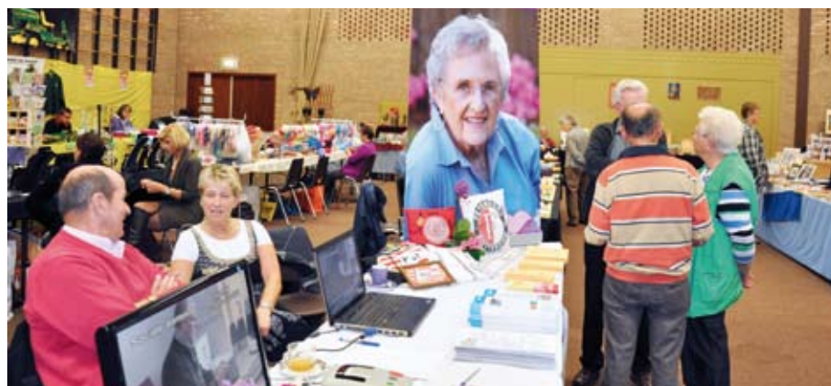
SWOM doet dit jaar weer mee aan Hobby-Doewat op 2 oktober

Op zondag 2 oktober neemt SWOM deel aan de manifestatie Hobby-Doewat in sporthal 'De Looierij' aan de Brandsestraat 1c in Mill. Deze manifestatie wordt georganiseerd door het Senioren Hobby Centrum, dat hiervoor samenwerkt met de KBO's en de SWOM.