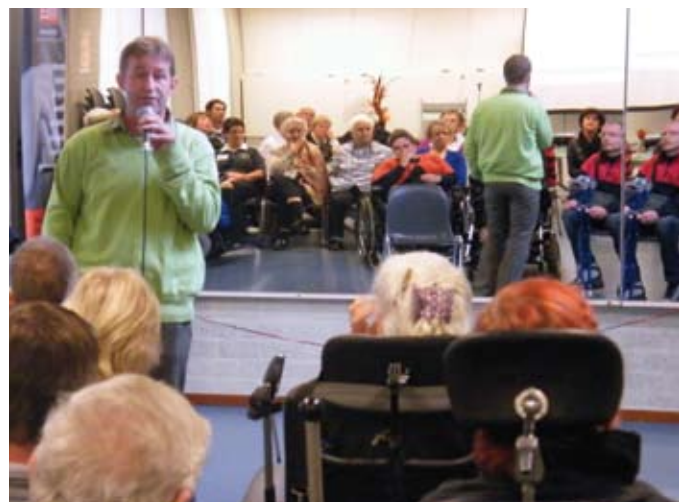
De informatiemiddag van het PGM was vorig jaar heel succesvol